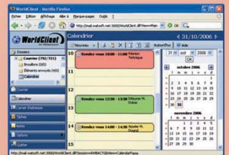
Interface WorldClient, thème LookOut