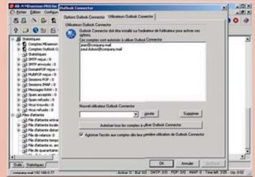
Interface d'options et de paramètres

Avec ses nombreux modules, MDAemon vous offre bien plus qu'une solution de messagerie. Découvrez-les sur : www.computer-center.fr